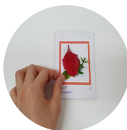
사진 판에 주워 온 식물을 올려요.